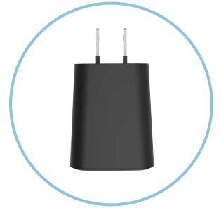
専用 AC アダプター付属