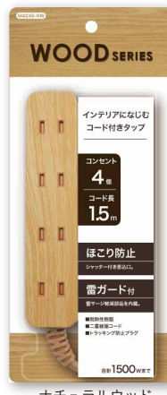
ナチュラルウッド

品名: コードタップ4個口 ダークウッド1.5m 品番: M4249-DW JAN: 4936960 112155